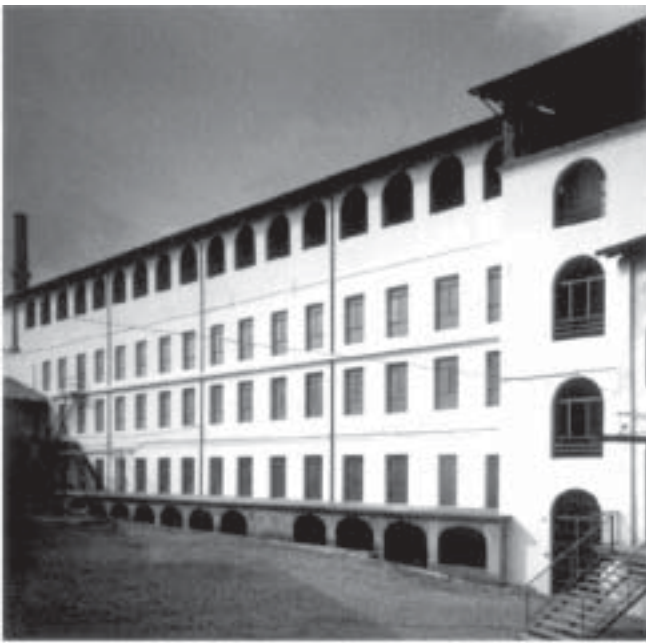
Fondazione Pistoletto - Cittadellarte, Biella

Con il termine internazionalizzazione indichiamo un fenomeno diverso sia dalla delocalizzazione che dalla semplice propensione alle esportazioni.