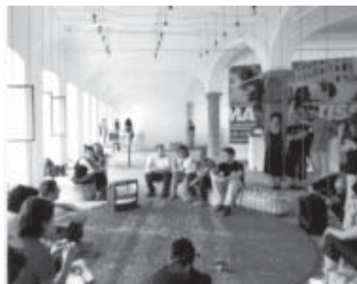
Spazi espositivi - Cittadellarte, Biella