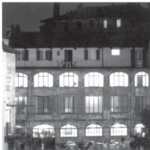
Fondazione Pistoletto - Cittadellarte, Biella

rischia di intralciare le scelte degli operatori industriali. Per questo entro il 2002 la regione Veneto mira a rivedere la propria legge con un tavolo di lavoro comprendente tutti i distretti veneti, senza per questo ricorrere all'utilizzo di ulteriori fondi: "non strutture ma progetti". Mentre le imprese, in silenzio e senza cabine di regia, cercano di fare il possibile per non rimanere spiazzate dalla globalizzazione, lo Stato, le Regioni e gli altri Enti Locali fanno ancora fatica a tenere il loro passo. I distretti italiani stanno vivendo un periodo di grandi trasfor-