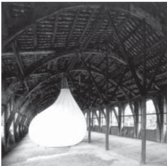
Tendopoli informatica - Cittadellarte, Biella