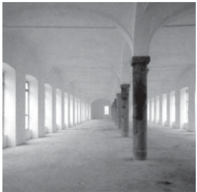
Spazi espositivi - Cittadellarte, Biella

C' è un altro fenomeno, forse non meno insidioso, legato alla sfida dell'internazionalizzazione. Oltre alla pressione della concorrenza internazionale e ai fenomeni di "migrazione imprenditoriale" che parte dai nostri distretti, sta crescendo anche il numero di casi di grandi gruppi esteri che effettuano investimenti nei distretti per beneficiare della vicinanza alle grandi riserve di know-how e di capacità di realizzazione di prototipi tanto diffuse nei distretti italiani. I due fenomeni ( essere preda e al tempo stesso andare a caccia di prede ) sono